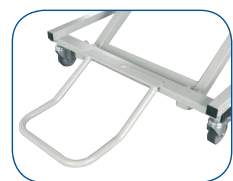
Tope mural incluido (de serie)