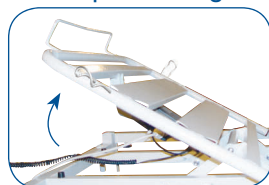
Elevador de respaldo con traslación. Permite evitar el deslizamiento hacia delante.