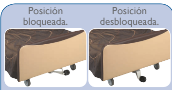
Posición bloqueada. Posición desbloqueada. Los pedales "mariposa" están situados en las 2 ruedas en el pie de cama Ruedas Ø 100 mm.

Freno independiente en cada rueda de la cama