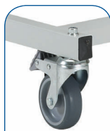
Ruedas Ø75 mm

Freno independiente en cada rueda de la cama