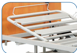
Elevador de respaldo eléctrico (estándar).

EL ELEVADOR DE RESPALDO: se pueden elegir diferentes versiones de elevadores de respaldo.