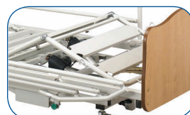
Elevador de piernas con plegado de rodillas.