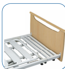
Extensión de somier de 20 cm