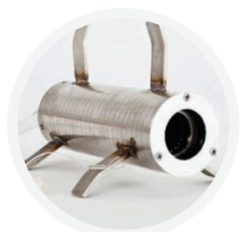
Rotationsbase til støbning ned i gulvet.